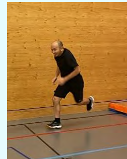
Sosuke gibt vollen Einsatz!

Da wir neu nach Trimmis gezogen sind, überzeugte mich meine Frau davon, dass ich zur Integration doch am Besten in einen Verein gehen soll. Zudem müsste auch der Bauchspeck mal vielleicht wieder weg, meinte sie. Zum Turnen selber, finde ich alles positiv. Es gibt nichts, was mir nicht gefällt. 🖱